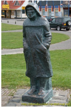
Visserman III, beeld van Anna op 't Land in Callantsoog

Punten 8, 9 en 10 liggen buiten het gebied van de kaart, aangegeven met dubbele pijlen